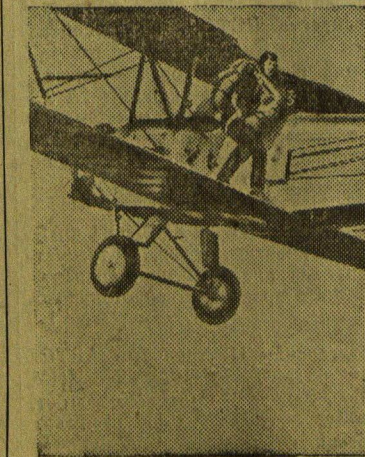
Воздушный спорт в СССР. На снимке: прыжок парашютиста.

Регулярно и хорошо работает кружок юных авиамodelистов при городском Доме пионеров. В порядке оказания шефской помощи Пятигорский аэропорт отпустил необходимое для этого кружка количество бензина, казenna (специальный